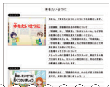
■ ストーリーの原稿