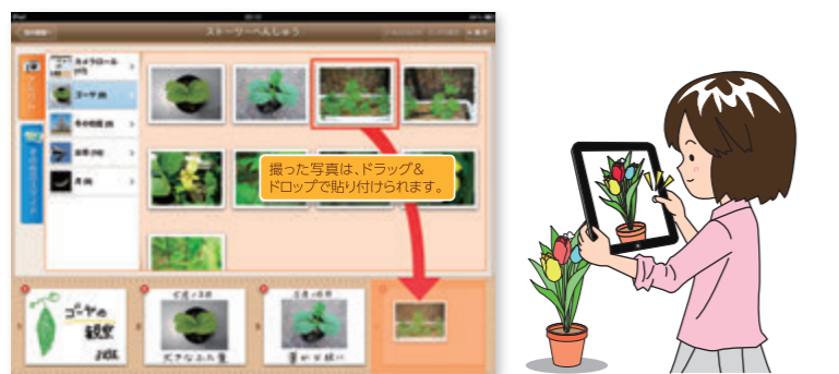
● 写真を撮って並べる

〈QBプレゼン〉では、写真を選びストーリーを組み立てる画面から制作が始まります。子どもたちはストーリーを組み立て、考えをまとめることを優先でき、自然とプレゼンテーション能力が身に付きます。