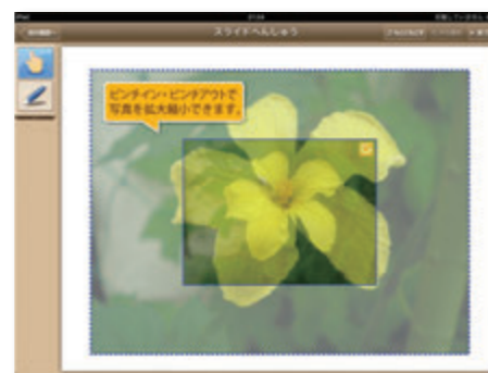
● 写真を指で簡単にサイズ調整

短時間でスライドを作成するために、機能は写真のサイズの調整と手書きの書き込みのみ!シンプルだからこそ、気軽に普段使いができるアプリです。