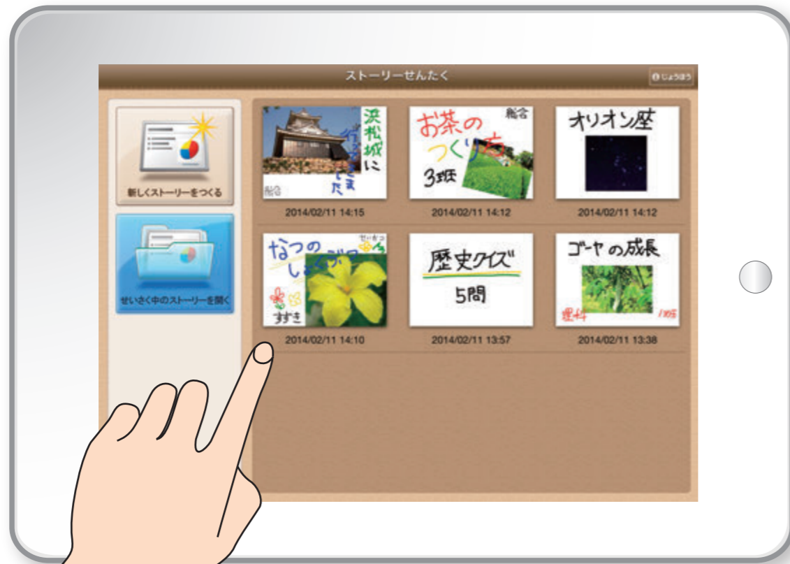
QBプレゼン ▶ ストーリーせんたく