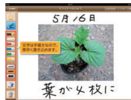
● スライドに書き込み