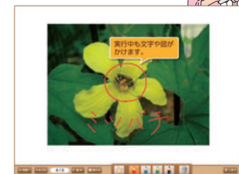
● 発表中も書き込みができる

発表中も手書きの書き込みができ、焦点化したいところを簡単に指し示すことができます。