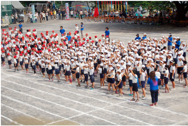
↑閉会式で、手をあげて笑顔で喜ぶ白組

団体種目は、低学年のダンス、中学年のソーラン節、高学年の組体操、そして学級対抗リレー、応援合戦、綱引きと続き、どれも見応えのあるものばかりでした。すべての競技が終わり、閉会式で結果が発表されました。わずか六点差で白組が